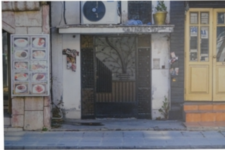
Denise Tombers (*1990) o.T. Aus der Serie „Lost Places“, 2018 Fotodruck auf Alu Dibond 45 x 30 cm