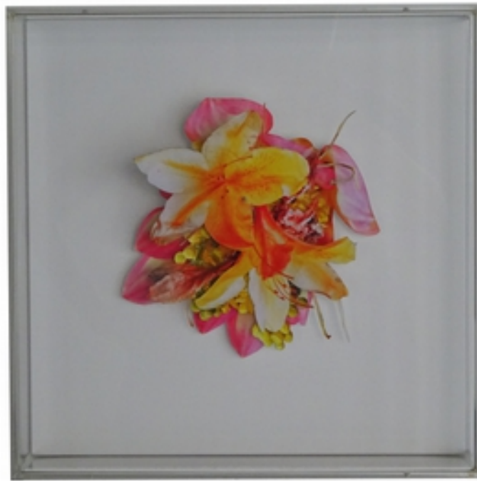
Gudrun Teich (*1961) Blume, 2017 Dreidimensionale Fotocollage in Plexiglaskasten 40 x 40 cm signiert