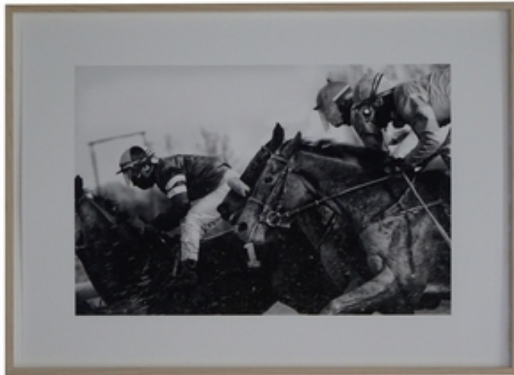
Britta Strohschen Races II, 2018 Digitalprint auf Fotopapier (Handabzug) 42 x 59 cm, Rahmenmaß: 46 x 63,5 cm signiert Exemplar 1/3