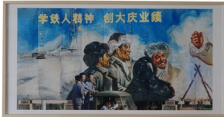
Klaus Mettig (*1950) China, 1978/2017 Archival Print auf Supreme Matte Karton 55,5 x 111,5 cm, Rahmenmaß: 60 x 116 cm signiert AP 1