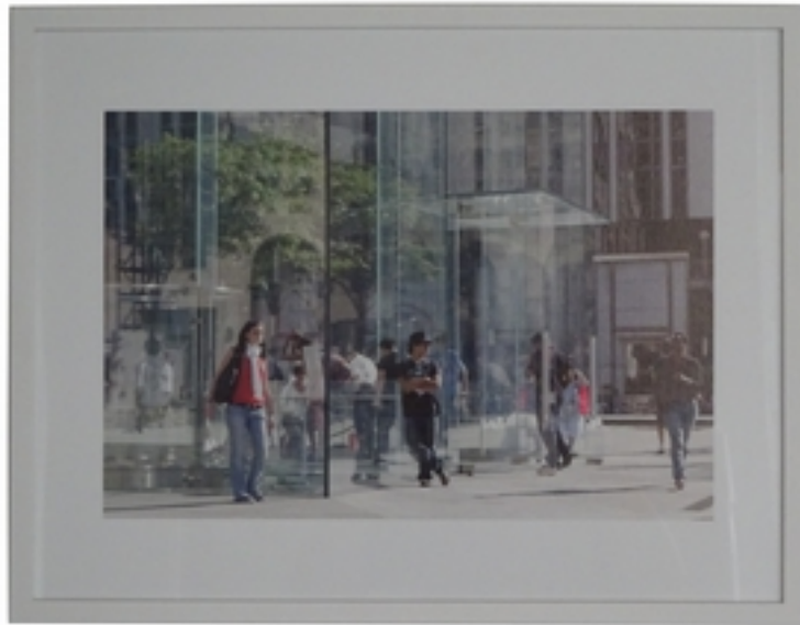
Gudrun Kemska (*1961) Apple Store 2, 2013 28 x 40 cm, Rahmen: 42,5 x 52,5 cm C-Print auf Fotopapier Exemplar: 1/10