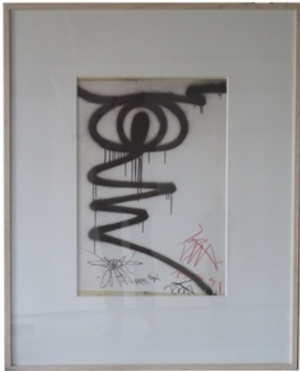
Harald Naegeli (*1939) Aus dem Ursprung der Linie, 2012 (signiert 2018) Plakatdruck auf Papier Rahmenmaß: 374,9 x 94,5 cm signiert