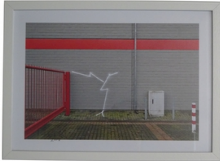
Harald Naegeli (*1939) o.T., 2018 C-Print auf Fotopapier Foto: Wolfgang Spiller (1950) 24 x 34 cm, Rahmenmaß: 32,5 x 42,5 cm signiert Auflage: 5 Exemplare 250,- € inklusive Rahmung