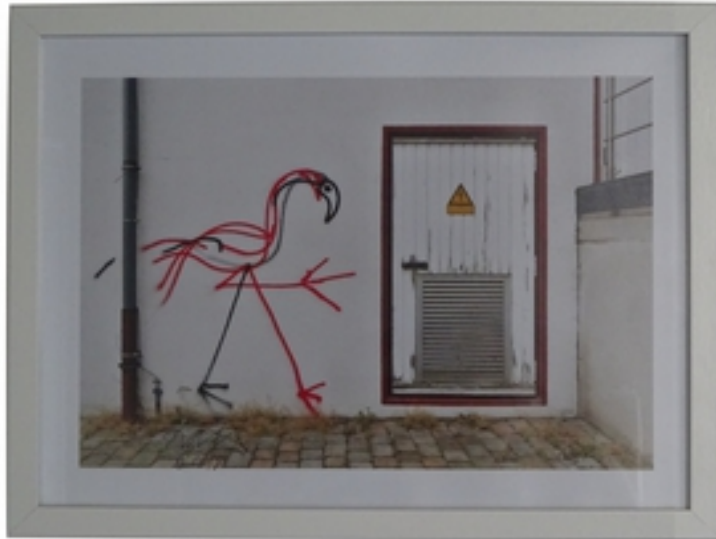
Harald Naegeli (*1939) Flamingo, 2018 C-Print auf Fotopapier Foto: Wolfgang Spiller (1950) 24 x 34 cm, Rahmenmaß: 32,5 x 42,5 cm signiert