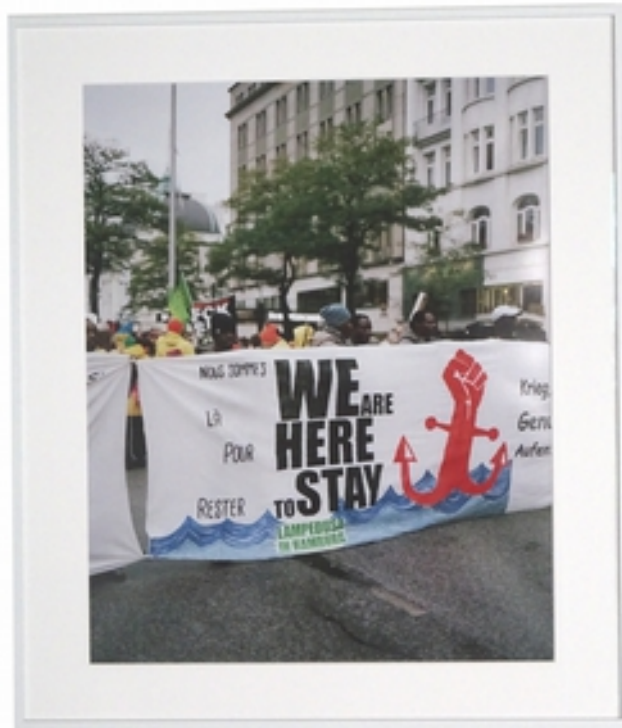
Andreas Langfeld (*1984) o.T., 2018 („Hamburg“ aus der Serie „Status“, 2013) C-Print auf Fotopapier 60 x 48 cm, Rahmenmaß: 70 x 60 cm signiert Exemplar 1/5 + 2 AP