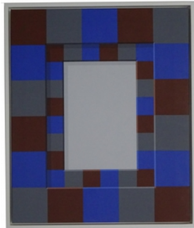
Stefan Lausch (*1966) Passepartout-Bild (Variationen zu Entwurf A 151014-b), 2015 Acryl auf Nessel 60 x 50 cm signiert